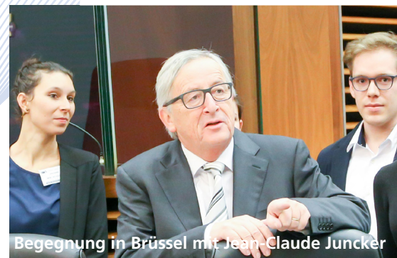
Begegnung in Brüssel mit Jean-Claude Juncker