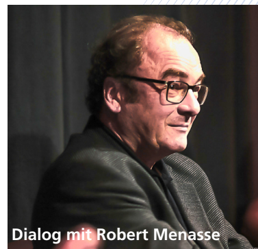
Dialog mit Robert Menasse